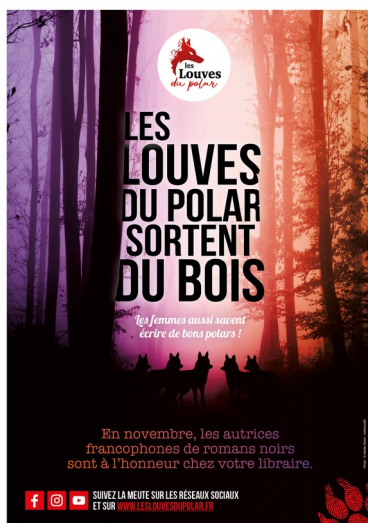
Poster A2 - Affiche A3

« Pour cette opération 2023, le contenu des kits monte en gamme. En plus des supports proposés en 2022 (affiches A3, marque-pages et macarons), des posters A2 et des dépliants A5 seront envoyés aux partenaires et une vidéo de lancement sera diffusée sur les réseaux sociaux. J'ai travaillé sur un slogan encore plus percutant et sur un design graphique coloré pour une bonne visibilité en librairie. Le dépliant 3 volets présente les dernières parutions des 31 autrices du collectif : un outil pratique pour les libraires qui souhaitent promouvoir les Louves du polar. » explique Chrystel Duchamp, cofondatrice et graphiste du collectif.