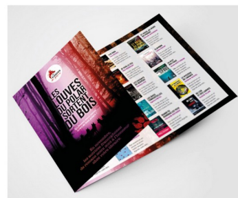
Dépliant A5 - 3 volets - Présentation des nouveautés de toutes les Louves